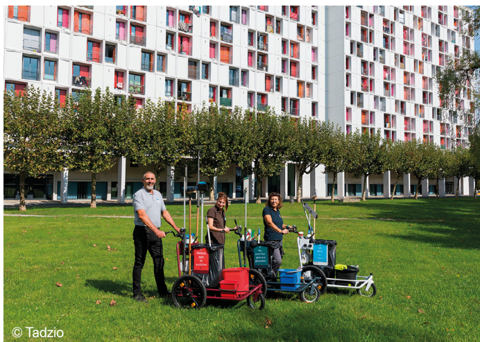
Normal Studio, Le Messenger , 2014, Bayonne, Pyrénées-Atlantiques (64)

Améliorer le quotidien des commanditaires et permettre d'établir de nouvelles relations de confiance avec les habitants et habitantes par la création d'un outil de travail adapté. Une commande d'agents et agentes d'entretien et du comité d'hygiène, de sécurité et des conditions de travail d'Habitat Sud Atlantique à l'agence de création industrielle Normal Studio. Médiation-production : Pointdefuite