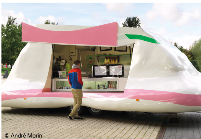
Erwin Wurm, Bob , 2013, Lille, Nord (59)

Interpeller les nouvelles générations et leur donner le désir de continuer à faire vivre une tradition séculaire avec un prototype de pigeonnier. Une commande des membres de l'association de colombophilie de Beauvois-en-Cambrésis, du Syndicat du Val de Riot et du directeur de la Base de loisirs de Caudry. Médiation-production : artconnexion