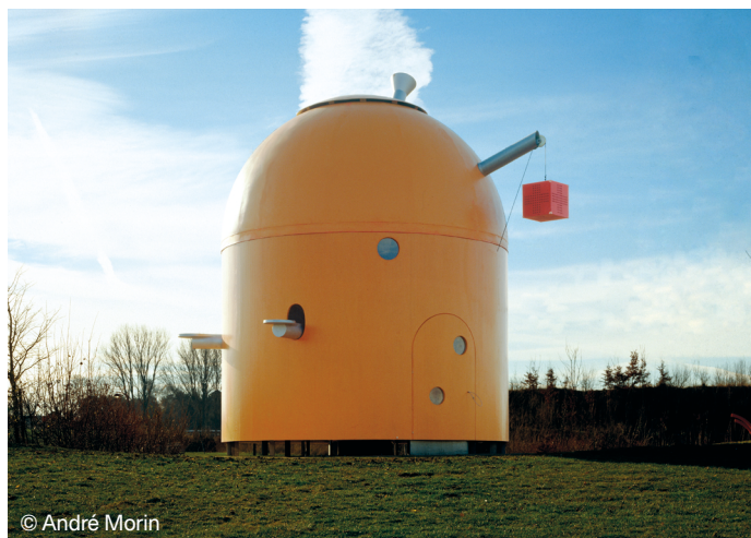
Matali Crasset, Capsule , 2003, Caudry, Nord (59)

Améliorer le quotidien des commanditaires et permettre d'établir de nouvelles relations de confiance avec les habitants et habitantes par la création d'un outil de travail adapté. Une commande d'agents et agentes d'entretien et du comité d'hygiène, de sécurité et des conditions de travail d'Habitat Sud Atlantique à l'agence de création industrielle Normal Studio. Médiation-production : Pointdefuite